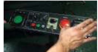
③ボタンを離して速やかに(0.5秒)停止すればOKです。