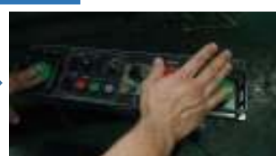
②非常停止ボタンを押します。