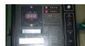
③押しボタンを押して、プレスが動かなければOKです。