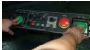
②両手押しで動かして、