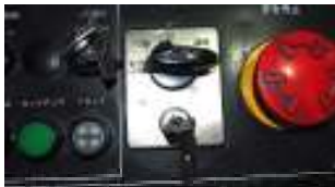
①安全一工程に合わせます。