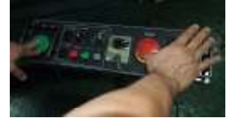
③ボタンを片方離して止まることを確認します。