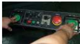
⑤これを左右両方のボタンで確認します。