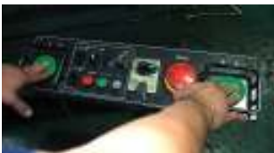
④離れた方のボタンをもう一度押しも動き出さないことを確認します。