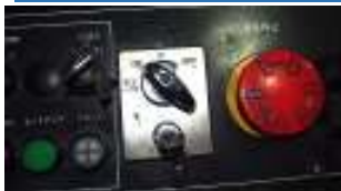
①寸動に合わせます。