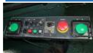
①ワシノ200tプレス機の操作盤です。